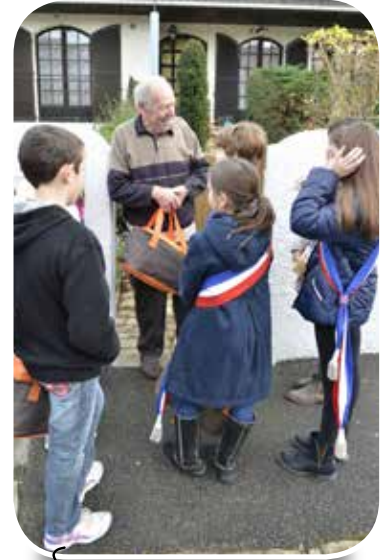
Distribution de colis de Noël par le CME