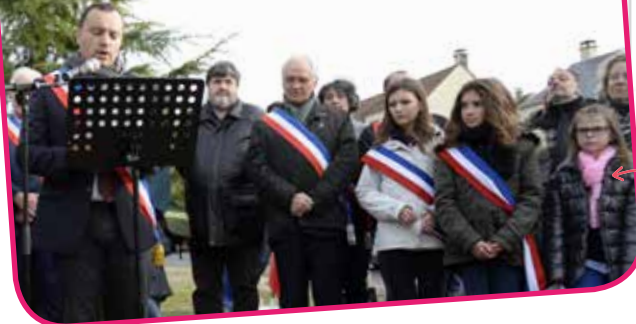
Plantation de l'arbre de la liberté